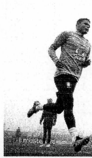
O Brasil tem a melhor defesa na competição, não tendo sido vazado em seus dois jogos no torneio

Essa solidez defensiva faz com que a seleção brasileira não só lidere com folga a disputa classificatória para o Mundial (seis vitórias em seis partidas), mas também seja vista por concorrentes como uma equipe mais madura que suas adversárias sul-americanas. "Em todas as equipes eu vi coisas boas ofensivamente, e defensivamente aspectos a serem melhorados. Menos o Brasil, que tem a melhor defesa, uma das explicações do porquê leva tanta vantagem na pontuação em seis rodadas das Eliminatórias. É um rival duro", disse o técnico do