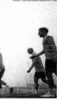
três gols sob comando do técnico. Em setembro de 2019, a Colômbia empatou com os brasileiros por 2 a 2, em amistoso disputado nos Estados Unidos. Casemiro abriu o placar, mas Muriel anotou duas vezes e colocou os colombianos na frente. Neymar deu números finais ao jogo.

Nesta quarta-feira, a seleção brasileira enfrentará um dos três adversários que já marcaram dois gols na equipe de Tite em uma mesma partida - o Brasil nunca levou