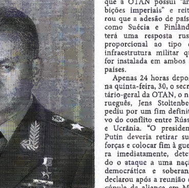
O ministro de defesa russo, Serguei Shoigu, afirmou neste domingo que a região de Luhansk havia sido "libertada"

lançadores de foguetes. De acordo com o prefeito da cidade, Vadim Lyakh, muitas pessoas foram mortas e o ataque também teria deixado diversos feridos. Kiev afirma que os ataques foram intensificados também longe de regiões do leste da Ucrânia e que civis estão sendo atingidos deliberadamente. A Rússia, por sua vez, afirma que os alvos são militares e que as forças armadas do país "não trabalham com alvos civis".