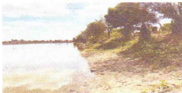
Foto 04: Descida d'água a ser executada entre a avenida Francisco das Chagas de Souza e o açude calazar