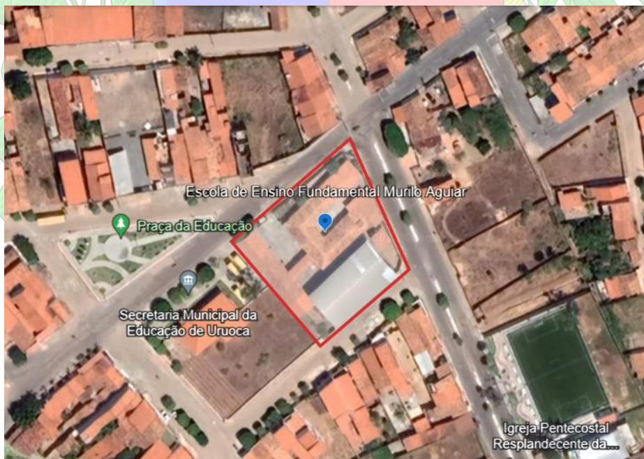
IMAGEM 01: Localização da reforma e ampliação da Escola de Ensino Fundamental Murilo Aguiar, localizada na Avenida Brasília, Bairro Roberto Dourado, Número: 47, no município de Uruoca/CE. (Google Earth). GPS – 0327036,9633794.

A obra em questão refere-se a reforma e ampliação da Escola de Ensino Fundamental Murilo Aguiar, localizada na Avenida Brasília, Bairro Roberto Dourado, Número: 47, no município de Uruoca/CE. Coordenadas Geográficas em decimal: -3.31180611, -40.55681133. Conforme a imagem abaixo: