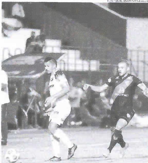
Próxima partida do Ceará será na próxima quinta-feira contra o Corinthians, na Arena Castelão