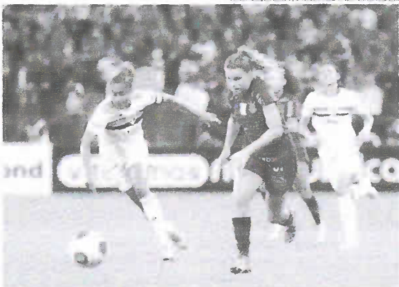
Com o resultado, o Corinthians se transformou em tricampeão de torneio estadual de forma invicta

O título desta quarta-feira igualou o Corinthians a outros três clubes também tricampeões paulistas: São José, Botucatu e Portuguesa. Os maiores vencedores do estado são Santos, Ferroviária e Juventus, com quatro