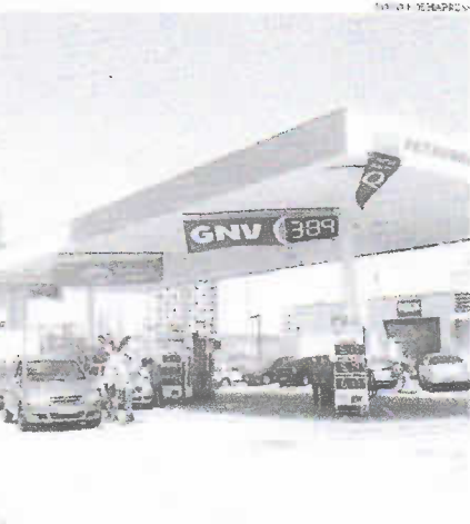
Segundo a estatal, valor médio de venda do combustível para distribuidoras será reduzido em R$ 0,10, passando de R$ 3,19 para R$ 3,09 por litro

O cenário levou o presidente Iau Bolsonaro a afirmar no início do mês que a Petrobras estava prestes