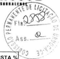
TABELA DE ENCARGOS SOCIAIS