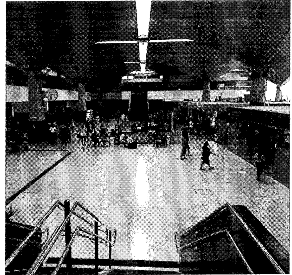
Mais de 11 mil pessoas deverão passar pelos terminais na próxima sexta-feira, 22

Segundo as expectativas divulgadas, o dia de maior movimento nos terminais rodoviários deverá ser a próxima sexta-feira,