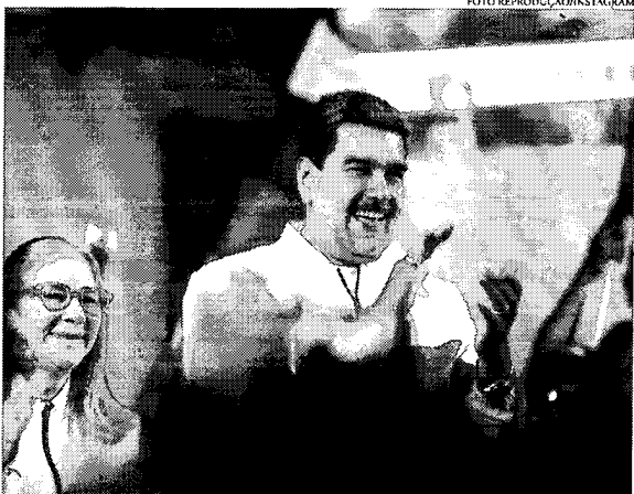
Autoridades venezuelanas afirmaram que a votação contou com mais de 10,5 milhões de votos a favor da vida

O presidente afirmou ainda que ocorreu “um dia maravilhoso de unidade nacional, abraçados em família para ouvir a voz do povo e decidir o rumo desta polêmica”. “Demos um grande passo para toda a Venezuela”, celebrou. As sessões de votação abriram às 6h no país e fecharam apenas às 20h, uma vez que foram concedidas duas horas de prorrogação. É válido lembrar que o referendo em si contraria uma ordem da Corte Internacional de Justiça (CIJ), cuja jurisdição não é reconhecida pelos venezuelanos, que determinou na sexta-feira, 01, que o governo de Maduro se abstenesse de fazer “qualquer ato que possa mudar