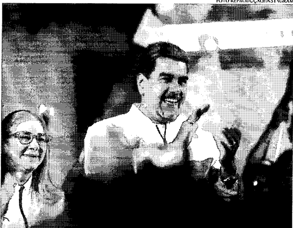
Autoridades venezuelanas afirmaram que a votação contou com mais de 10,5 milhões de votos a favor da vida

O presidente afirmou ainda que ocorreu “um dia maravilhoso dos venezuelanos nacional, abraçados em família para ouvir a voz do povo e decidir o rumo desta polêmica”. “Demos um grande passo para toda a Venezuela”, celebrou. As sessões de votação abriram às 6h no país e fecharam apenas às 20h, uma vez que foram concedidas duas horas de prorrogação. É válido lembrar que o referendo em si contraria uma ordem da Corte Internacional de Justiça (CIJ), cuja jurisdição não é reconhecida pelos venezuelanos, que determinou na sexta-feira, 01, que o governo de Maduro se abstinêsse de fazer “qualquer ação que pudesse mudar