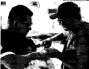
Além de proteger cães e gatos, a vacina ajuda a evitar a transmissão da doença para humanos

No ano passado, Fortaleza também conseguiu atingir a meta para cães determinada pelo Ministério da Saúde, de 80%, ao vacinar um total de 322.320 ani-