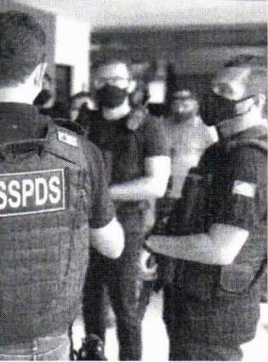
Redução nos crimes é atribuída ao trabalho continuado desenvolvido pela Secretaria da Segurança Pública e Defesa Social (SSPDS)

A diminuição dos assassinatos em 2023 no Ceará, mantém uma tendência de queda registrada pelos dados Supesp desde o balanço de 2018, onde foram registrados 4.518 CVLI; em 2019 houve uma queda de quase 50%, com 2.257 CVLI; tendo um aumento no ano de 2020 de 4.039 CVLI; voltando a cair em