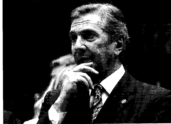
O ex-presidente Fernando Collor (PTB), deverá ser preso após julgamento de eventuais recursos

O Supremo Tribunal Federal (STF) decidiu, nessa quarta-feira (31), aplicar pena de oito anos e dez meses de prisão, em regime inicial fechado, ao ex-presidente Fernando Collor (PTB) pela prática dos crimes de corrupção passiva e lavagem de dinheiro. Ele também foi condenado a 90 dias-multa, cada um deles definido como cinco salários mínimos à época dos últimos fatos apontados na acusação, em 2014, corrigidos pela inflação, o que pode exceder R$ 500 mil. O Código Penal estabelece que o condenado com pena superior a oito anos de prisão deve começar a cumpri-la em regime fechado. Os ministros do STF também entenderam que o ex-presidente integrava associação criminosa e seria condenado a mais dois anos de prisão, mas para esse crime houve prescrição. Além disso, Collor foi condenado a pagar, junto com os outros condenados, indenização por danos morais coletivos de R$ 20 milhões, que é o valor que eles teriam recebido de propina. Foram condenados, além do ex-presidente, outros dois acusados de participarem do esquema. A decisão do STF foi tomada na sétima sessão de julgamento do processo contra