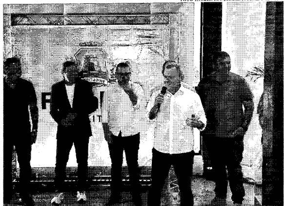
A novidade foi anunciada em coletiva de imprensa na sede da Citiviva