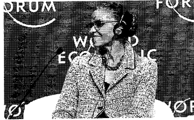
Marina Silva, ministra do Meio Ambiente e Mudança do Clima, em painel em Davos nesta segunda-feira (16)

A ministra do Meio Ambiente e Mudança do Clima, Marina Silva (Rede), foi aplaudida no painel de abertura do Fórum Aberto de Davos ontem (16) ao declarar que o terceiro governo Lula está comprometido com “desmatamento zero, proteção dos povos indígenas, democracia e sustentabilidade”. “Há uma grande expectativa em relação ao Brasil, que sempre contribuiu com agendas importantes de sustentabilidade. Infelizmente, nos quatro últimos anos, viramos párias”, disse a brasileira no painel intitulado “Em Harmonia com a Natureza”, que dividiu com personalidades como Hindou Oumarou Ibrahim, presidente da Associação de Mulheres e Povos Indígenas do Chade.