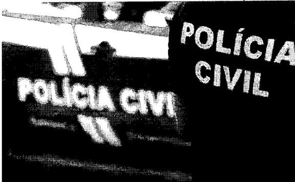
Em Fortaleza houve redução de 5,6%, ou seja ocorreram 850 mortes ao longo do ano passado e 900 em 2021

O Governo exemplificou as medidas de combate aos crimes, como "expansão e melhoria das estruturas das instituições; aumento de