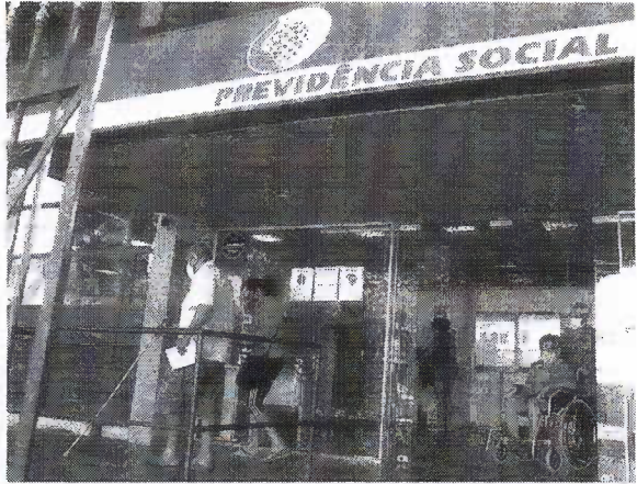
Para solicitar a revisão, cada aposentado deve acionar o Judiciário por meio de ação individual para que seu caso seja avaliado

Todos que tenham contribuído antes de julho de 1994 com o INSS serão beneficiados com a revisão da vida toda, mas é preciso acionar o Judiciário