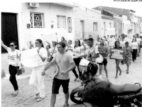
Professores saíram em passeata pelas principais ruas do centro de Cariús, buscando apoio