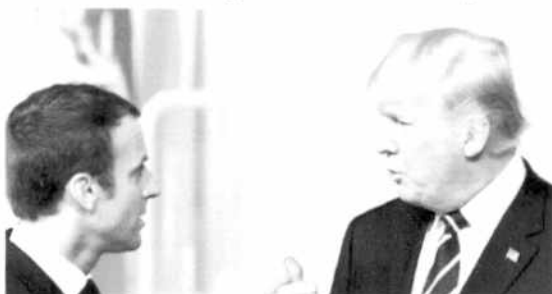
Emmanuel Macron e Donald Trump tentarão estreitar laços diplomáticos entre seus dois países

O presidente francês, Emmanuel Macron, aceitou o convite de seu homólogo americano, Donald Trump, para visitar os Estados Unidos de 23 a 25 de abril, anunciou a presidência francesa na noite de ontem, em um comunicado de imprensa.