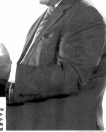
Cyril Ramaphosa assume país com a missão de estabilizar governo e melhorar a qualidade de vida da população local

Algumas das pastas que mudam de titular são as das Relações Exteriores, Energia, Educação Superior, Transporte, Turismo, Segurança, Desenvolvimento Rural e Reforma de Terras e Empresas públicas.