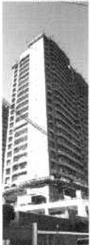
Construção civil ainda segue um ritmo muito aquém de suas possibilidades

ESTADO DO CEARÁ - PREFEITURA MUNICIPAL DE URUGUAIANA - CE - EDITAL DE LICITAÇÃO - O Município de Uruguaiana-CE, através do CPL, torna público a licitação para contratação de empresa especializada para prestação de serviços de construção de pavimentação em pontos locais, contratação de obras de praças e serviços de captação, instalação e a instalação de água de tratamento em pontos locais, para mais detalhes consultar o Edital em: Rua Manoel de Barros, nº 11, Centro, Uruguaiana-CE. Fone: (85) 4441-1076. E-mail: cpl@uruguaiana.ce.gov.br. Ataca a 21 Horas - Próximo da CPL.