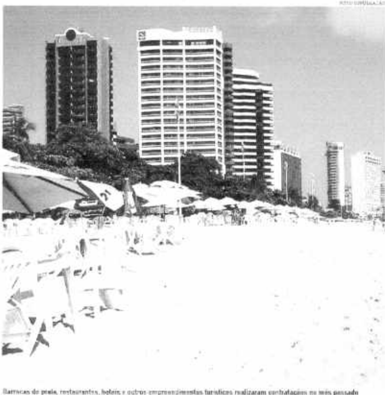
Barracas de praia, restaurantes, hotéis e outros empreendimentos turísticos realizaram contratações no mês passado

Nessa base, o crescimento registrado pelo Ceará (m de 836 vagas, recente que, no País, houve corte de 9.264 empregos) é o número no domínio não foram positivos. Em junho, os serviços ligados ao turismo criaram mais empregos, mas sua taxa se manteve a mesma. Enquanto que as demissões chegaram a 2735, em junho, o número de desempregados foi um ponto maior em maio, atingindo 8.774 (os balhadores). Nesse dia, mês, o desemprego acumulou 16,7 mil pessoas, reflexo do