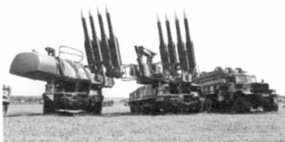
Exército russo vai expor ao mundo o seu arsenal bélico numa resposta às ameaças

A Rússia anunciou que fará o maior exercício militar desde 1981, quando ainda era o principal país da União Soviética e vivia sob dois auges da tensão geopolítica com o Ocidente. A motivação agora é a mesma: "A capacidade de defesa na atual situação internacional, que é frequentemente agressiva e hostil a nosso país, justifica (o exercício)", afirmou o porta-voz do Kremlin, Dmitry Peskov, nesta terça (28).