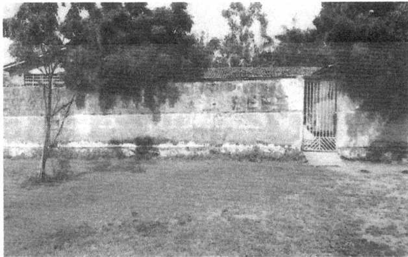
Foto 01: Fachada da edificação com elevado desgaste na pintura e no revestimento argamassado