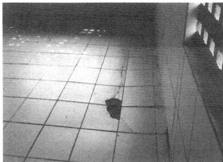
Foto 04: Afundamento do piso com descolamento das peças cerâmicas