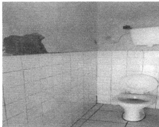
Foto 02: Banheiro da edificação sem acessibilidade, com presença de infiltrações e descolamento do revestimento argamassado e cerâmico

Handwritten signatures and initials in the bottom right corner of the page.