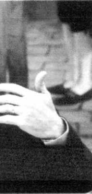
"O presidente é a vítima, ele é interessado na investigação", explicou Sergio Moro

do em São Paulo após passar por uma cirurgia em decorrência da facada, Bolsonaro divulgou um vídeo em que pediu uma solução para a investigação. "Espero [que] a nossa querida Polícia Federal, a polícia que nos orgulha a todos, tenha uma solução para o nosso caso nas próximas semanas", disse na ocasião. No vídeo, o presidente disse que o caso "não pode ficar impune".