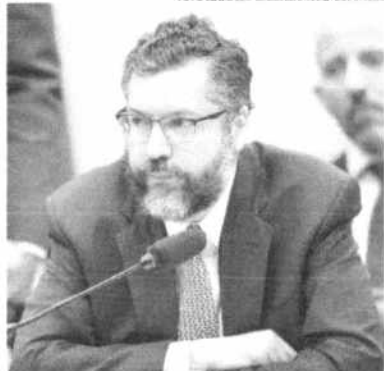
Não tenho a menor dúvida em relação a isso, diz Araújo

Ernesto Araújo negou que a política de aproximação com Estados Unidos represente uma ação de subserviência aos interesses norte-americanos