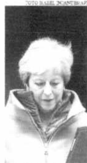
May está pressionada por conta da não aprovação do acordo de saída da UE

A primeira-ministra do Reino Unido, Theresa May, disse nesta terça-feira (26) a um grupo de deputados de seu Partido Conservador que vai deixar o posto se o acordo de saída do país da União Europeia for aprovado. Segundo parlamentares ouvidos pela agência Reuters, a chefe de governo não indicou uma data certa para a renúncia, mas espera-se que, havendo sinal verde do Legislativo para o pacto, ela se concretize no curto prazo.