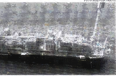
Intensificação do esforço exploratório da empresa é resultado das descobertas de petróleo na região do pré-sal, nas áreas de Alto de Cabo Frio Central e Aram.

Do total de investimentos programados, 58% serão destinados às Bacias do Sudeste; 38% à Margem Equatorial; e 2% às demais áreas. Nos próximos cinco anos, a estatal vai colocar em produção 15 navios-plataforma, do tipo sistema flutuante de produção, armazenagem e transferência de petróleo. Do total, dez navios plataformas serão instalados no pré-sal e cinco no pós-sal.